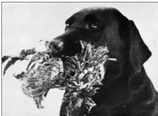
INT UCH Sandylands Twanah

År 1969 parades Twanah med INT UCH Puhs Grabb. I denna kull föddes kullsyskonen NORD & INT UCH, SE JCH Älvgårdens Flap och FI UCH Älvgårdens Flipper . Året därpå (1970) fick hon sin andra valpkull med Puhs Grabb vilken resulterade i de tre kullsyskonen INT UCH Älvgårdens Hunter , SE JCH Älvgårdens Hap-py samt SE JCH Älvgårdens Handy .