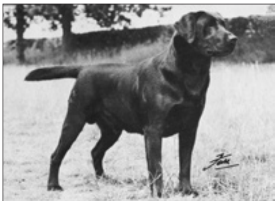
GB ShCh Sandylands Storm Along f. 1974

Sandylands Annabel parades med starkt Poppleton-influerade GB ShCh Garvel of Garshangan f. 1960 (GB Ch General of Garshangan – GB Ch Gussie of Garshangan) bland annat för att förbättra pigmentet på den gula linjen. Ur denna kombination kom Sandylands General (f. 1966) som parades med Marks kullsystem Sandylands Memory. I denna kull föddes GB ShCh Sandylands Garry år 1968. Hans dotter GB ShCh Sandylands Girl Friday undan Trewinnard Sandylands Tanita (Tan – Shadow kombinationen) parades med den framstående avelshanen GB Ch Follytower Merybrook Black Stormer (efter Tanitas kullbror GB Ch Sandylands Tandy). I denna valpkull föddes år 1974 GB ShCh Sandylands Storm Along som blev BIS på prestigefyllda Blackpool år 1976. Han var dessutom Top Stud Dog inom rasen i två år sin alltför tidiga död i cancer till trots. En stor förlust för kenneln och labradorrasen som sådan enligt Gwen själv.