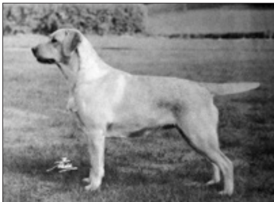
GB ShCh Sandylands Longley Come Rain f. 1974