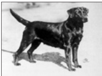
GB Ch June of Sandylands f. 1936