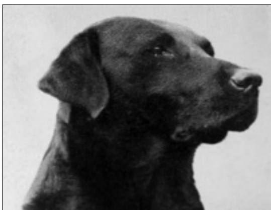
GB Ch Jerry of Sandylands