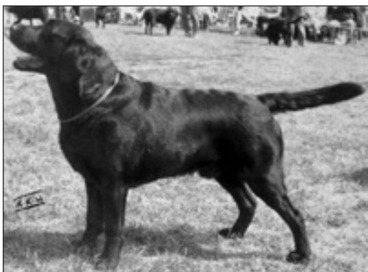
GB Ch Sandylands My Guy f. 1987

GB Sh Ch Sandylands Longly Come Rain (Sandylands Charlston – Longley in Tune) född 1974 var en värdefull avelstik på Sandylands och dominerade avelsprogrammet på 1980-talet och början av 1990-talet. Hennes stamtavla uppvisar i princip Sandylands kennels historia ända ner till de första Sandylands labradorerna.