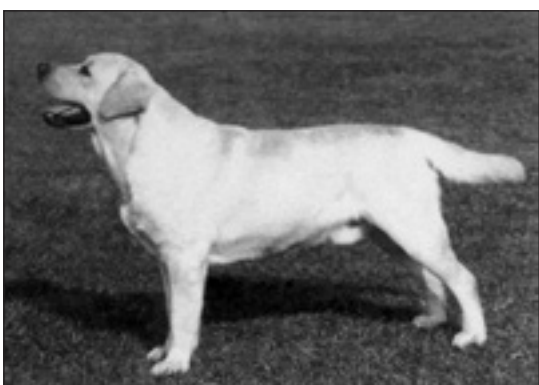
GB ShCh Sandylands Gad-About f. 1994