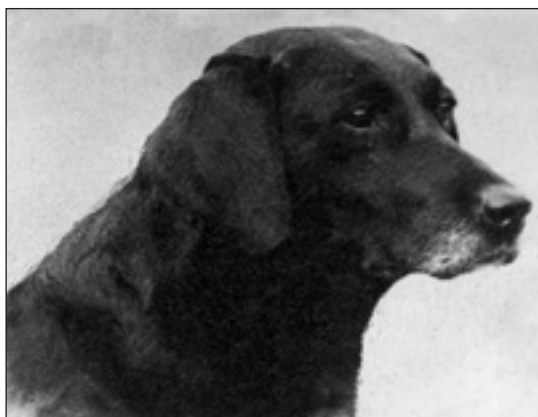
Juno of Sandylands