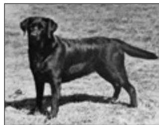
GB ShCh Sandylands Bella f. 1982