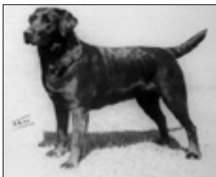
GB Ch Sandylands Truth f. 1960