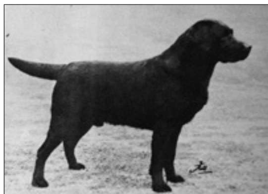
GB Ch Sandylands Tweed of Blaircourt f. 1958