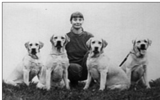
Sandylands Poser – två från höger – omgiven av sina avkommor från två olika kullar.