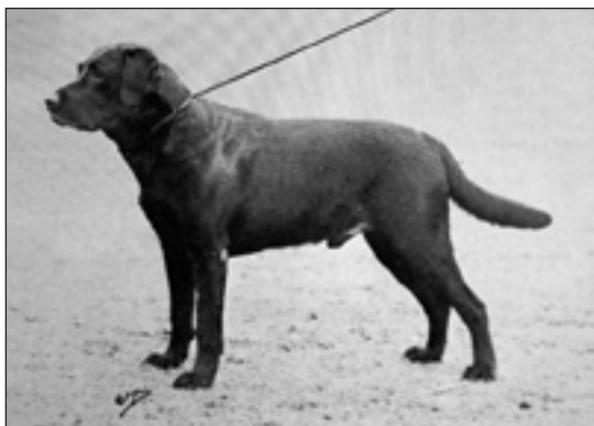
NORD UCH Sandylands Midnight Maestro