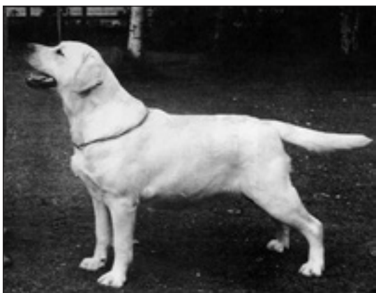
GB ShCh Sandylands Bliss f. 1990

År 1990 föddes GB Sh Ch Sandylands Bliss (GB Ch Trenow Brigadier – Sandylands Rae). Hon var barnbarn till Come Rain. Bliss anses vara en av de bästa "Show Labradors" i mitten av 1990-talet och jämförs med de allra bästa Sandylands-tikarna från 1970-talet som t ex GB Sh Ch Sandylands Mercy och GB ShCh Sandylands Busy Liz.